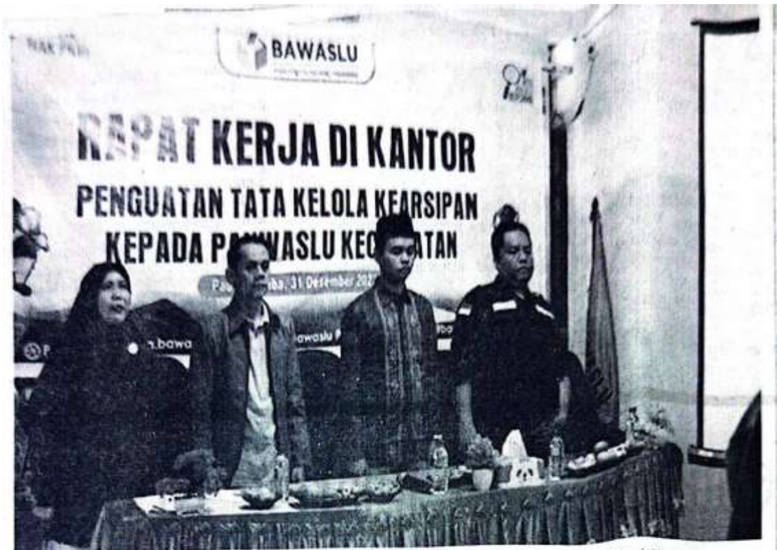
GELAR RAPAT— Rapat Kerja pengelolaan arsip yang dilaksanakan oleh Bawaslu Padang Pariaman, di Pauh Kamba (31/12).