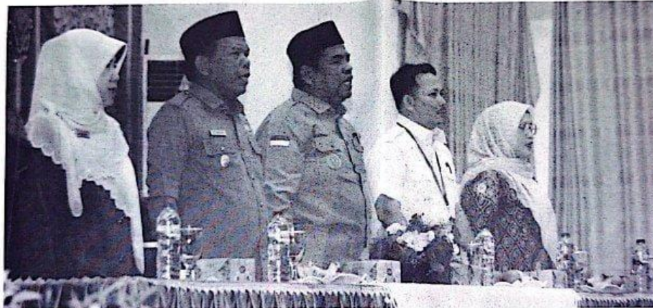
BUPATI Padang Pariaman Suhatri Bur saat membuka rakor Tim Percepatan Penurunan Stunting (TPPS).

"Pencapaian ini patut kita syukuri, namun bukan berarti kita boleh berpuas diri, kita harus terus bekerja keras untuk menurunkan angka stunting hingga mencapai target nasional