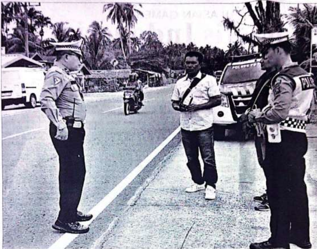
Kepolisian Resort Kabupaten Padang Pariaman, Sumbang sedang mengunjungi lokasi kecelakaan bersama sejumlah wartawan.