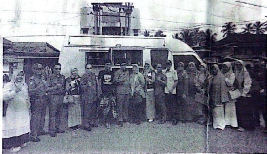
FOTO BERSAMA—Bupati Padangpariaman Suhatri Bur foto bersama dengan tim Dinas Kesehatan Kabupaten Padangpariaman dan Balai Besar POM Padang usai melakukan pengawasan di sejumlah pasar pabukoan.

Dia juga meminta masyarakat untuk menjadi konsumen yang cerdas, dengan cek kemasan, label, ijin edar, kadaluarsa ( Cek KLIK ) sebelum membeli/konsumsi pangan. "Jadialh konsumen yang cerdas dengan sebelum membeli barang kebutuhan