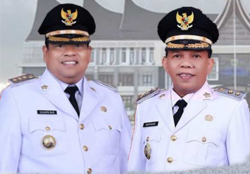
SUHATRI BUR, SE, MM BUPATI PADANG PARIAMAN