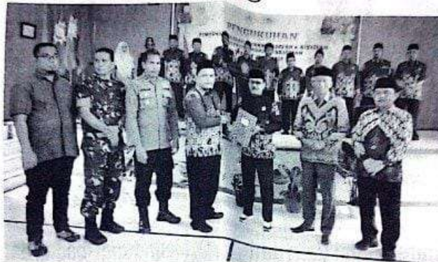
PENGUKUHAN Pengurus Dewan Pimpinan Daerah Padang Pariaman Periode 2023-2027 di Lubuk Alung, Minggu 24/09.

Dia berharap, PDM Padang Pariaman semakin baik. Konsolidasi organisasi berjalan dengan seluruh